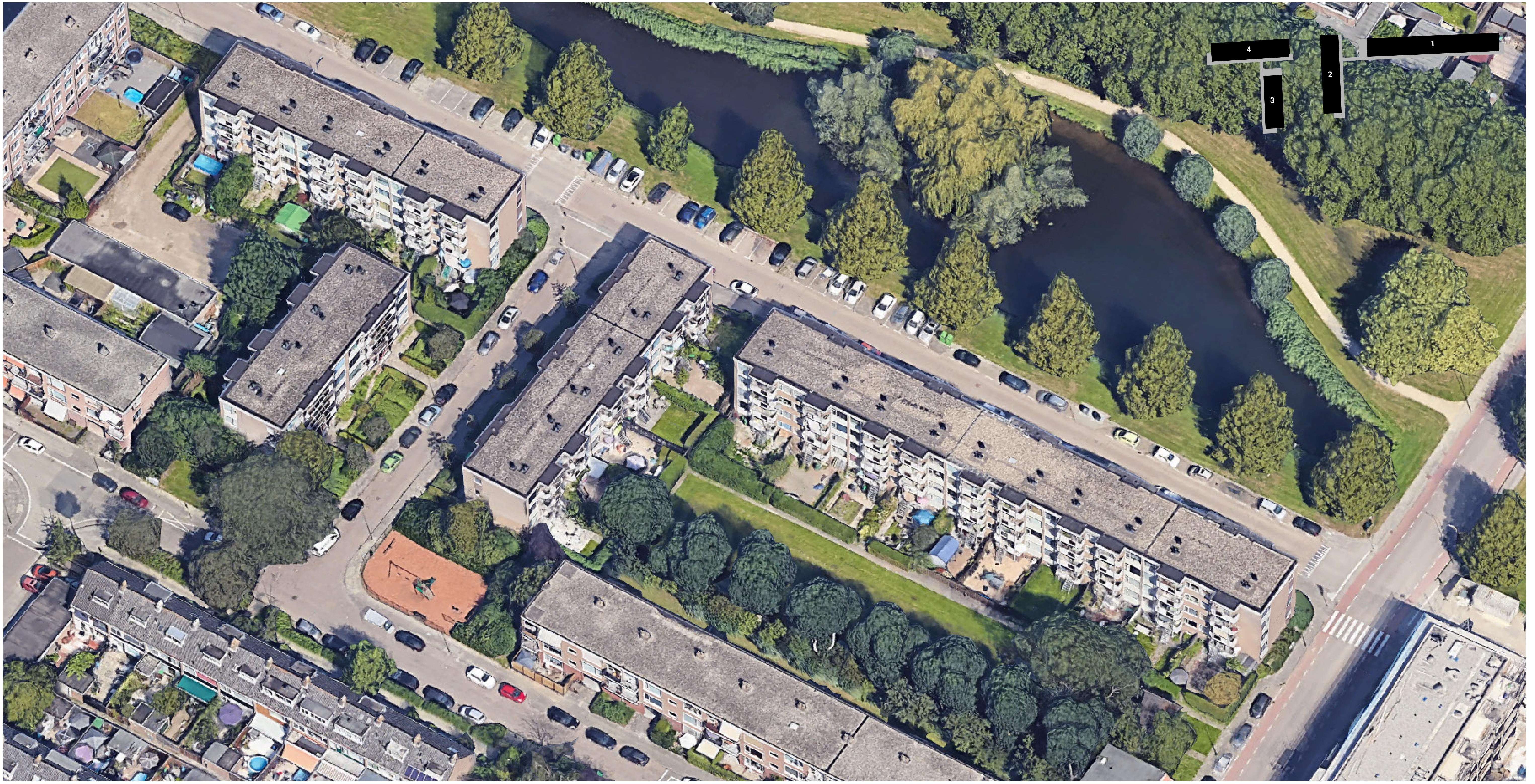
Situatie | Bestaand, sloop van 94 portiek woningen